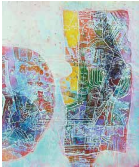
Abb.: Hasegawa „Vers L'espace“ „In den Raum“, 1994

Die Doppelausstellung steht unter dem Patronat der Münchener Generalkonsulate von Japan und Österreich.