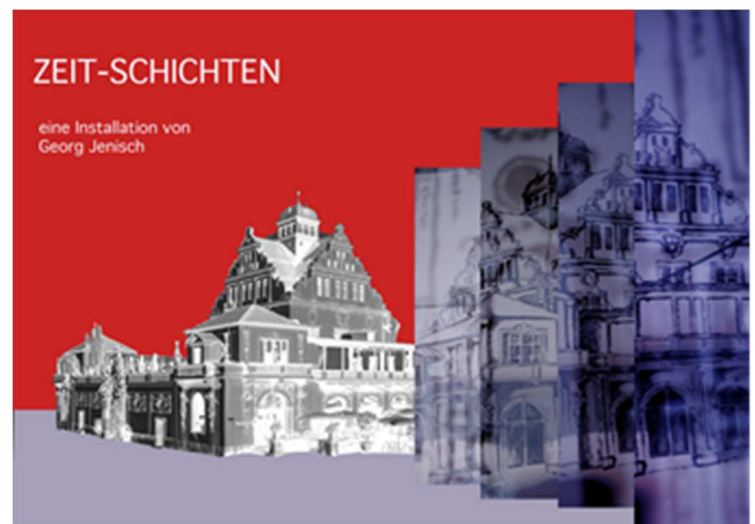
Das Münchner Künstlerhaus in der Installation