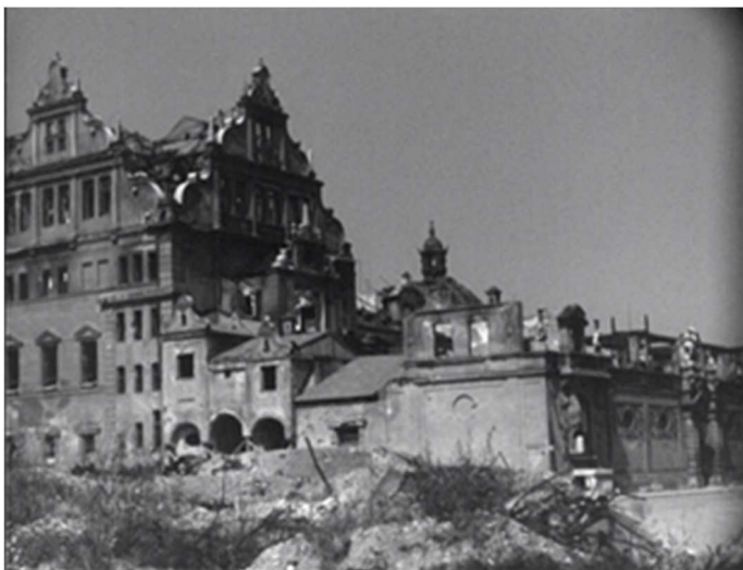
Das Münchner Künstlerhaus 1945, zerstört

Unter Einbeziehung unterschiedlichster Kunstrichtungen wie Malerei, Bildhauerei, Projektionen, Klang oder Streetart, zeigt die Installation „ZEIT-SCHICHTEN“ wie sich die Architektur und Innenausstattung des Münchner Künstlerhauses in den vergangenen hundert Jahren verändert hat.